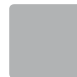
lightgrey / grigio cod. 338 G

The plastic covering is available in the following colors. Il carter è disponibile nei seguenti colori.