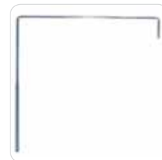
curtain-holder reggitelo cod. 315