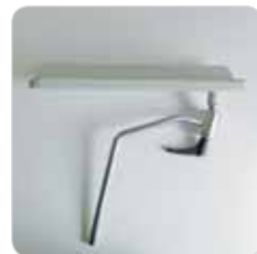
blood-sample taking armrest couple coppia braccioli da prelievo con snodo cod. 314