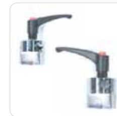
fixed and rotating clamps morsetti fissi e girevoli cod. 319-320