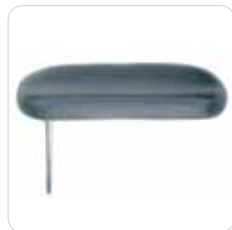
medical armrest couple coppia braccioli medicali cod. 313