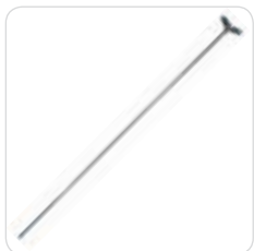
IV. rod asta porta flebo cod. 311