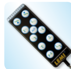
hand set control pulsantiera cod. LEM - 083