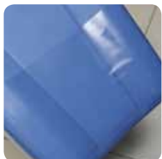
plastic cover proteggi gambe cod. Prot. gambe