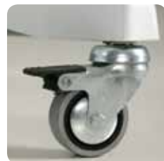
wheels ruote cod. LEM - 139