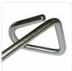
heel support couple coppia di reggi tallone cod. LEM - 151