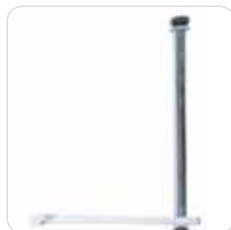
colposcope support supporto colposcopio cod. 312