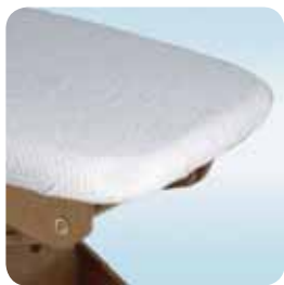
bed sponge cover coprilettino cod. 114