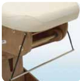
roll holder portarotolo cod. 108