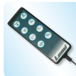
hand set control pulsantiera cod. SWC 23