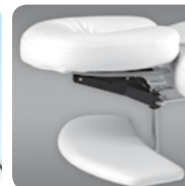
arm rest support supporto braccia cod. 076/BIS