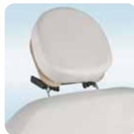
head rest w/out hole testa senza foro cod. 077/A