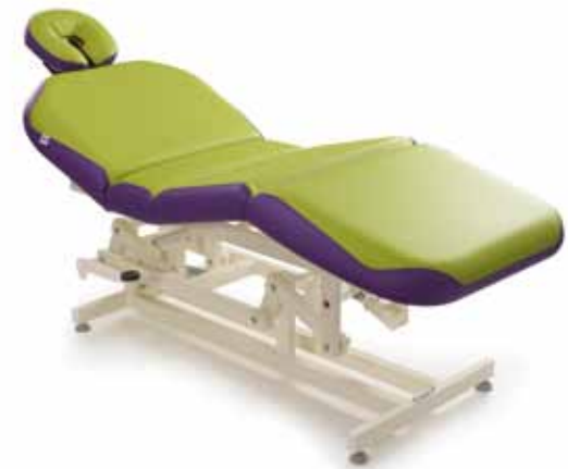
Sosul 2000 I • cod. 074