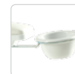
manicure bowls bacinelle manicure cod. 006