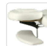
arm support supporto braccia cod. 076/bis