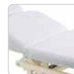
bed sponge cover copri lettino cod. 114