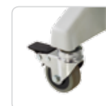
wheels ruote cod. LEM-139