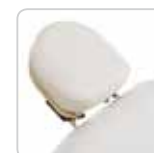
headrest w/out hole testa senza foro cod. 077/A