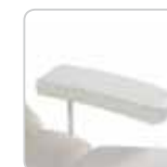
arm rest couple coppia di braccioli cod. 076