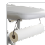
paper roll holder portarotolo cod. 108