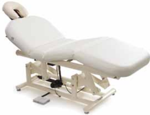
Sosul 2000 E • cod. 082-1