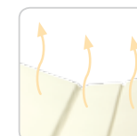
heating system riscaldamento cod. 180 S2