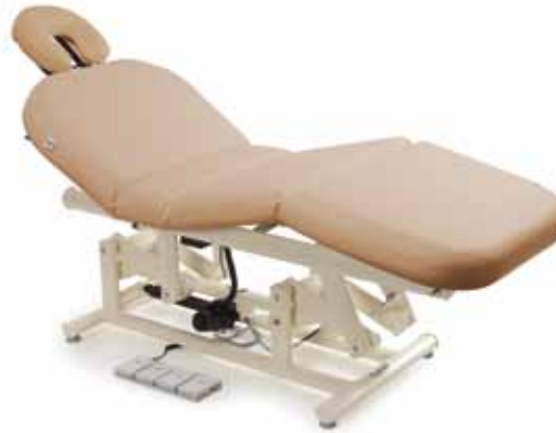
Sosul Top 2 M • cod. 082-2