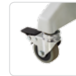
wheels ruote cod. LEM-139