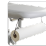
paper roll holder portarotolo cod. 108