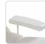
arm rest couple coppia di braccioli cod. 076