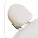
headrest w/out hole testa senza foro cod. 077/A