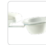
manicure bowls bacinelle manicure cod. 006