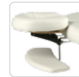
arm support supporto braccia cod. 076/bis