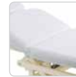
bed sponge cover copri lettino cod. 114