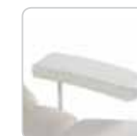
arm rest couple coppia di braccioli cod. 076