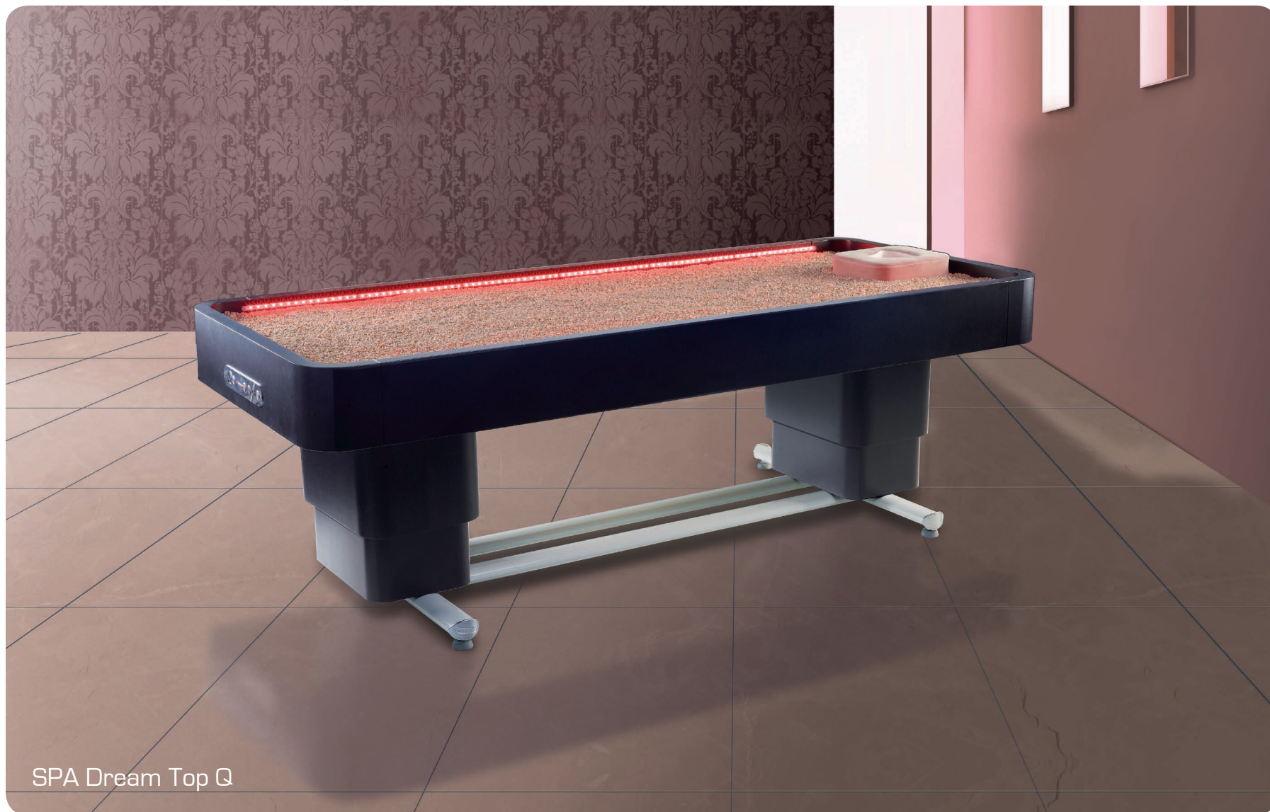
SPA Dream Top Q